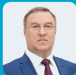
ЗАМЕСТИТЕЛЬ ГЛАВЫ РОССИЙСКОГО ГОСУДАРСТВЕННОГО GMP-ИНСПЕКТОРАТА, ДИРЕКТОР ФБУ «ГИЛС и НП» МИНПРОМТОРГА РОССИИ

«МАФИ ЕАЭС сегодня – неотъемлемый союзник регуляторных мероприятий, направленных на соблюдение целого комплекса GxP-стандартов.»